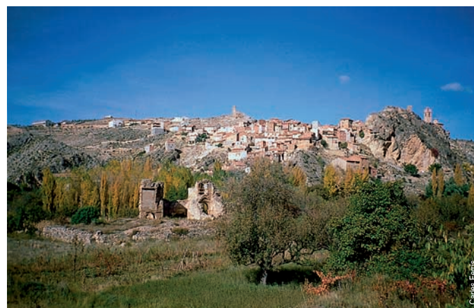
Castielfabib y las ruinas de San Guillermo