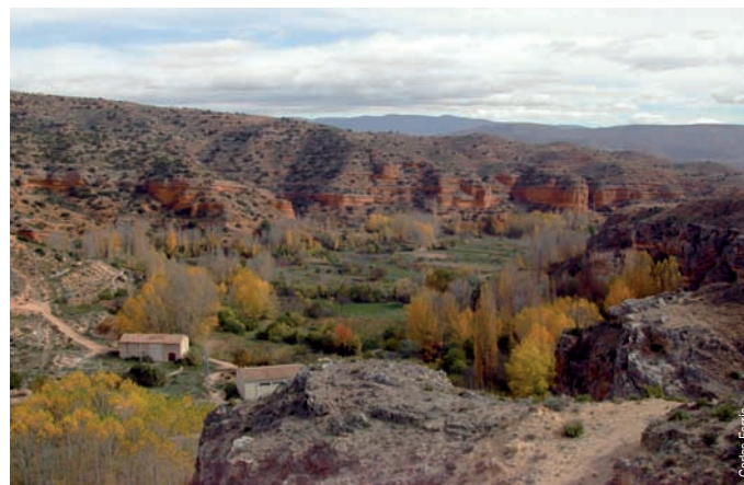
Senda del río Ebrón de Castielfabib a Torrebaja