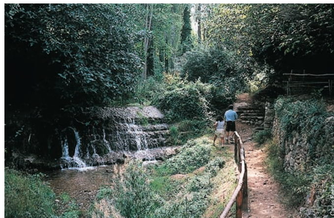
Paraje del río Bohilgues, Ademuz