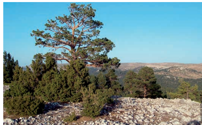
El Alto de las Barracas o Cerro Calderón, la cumbre más alta de la Comunidad Valenciana (1.836 m)