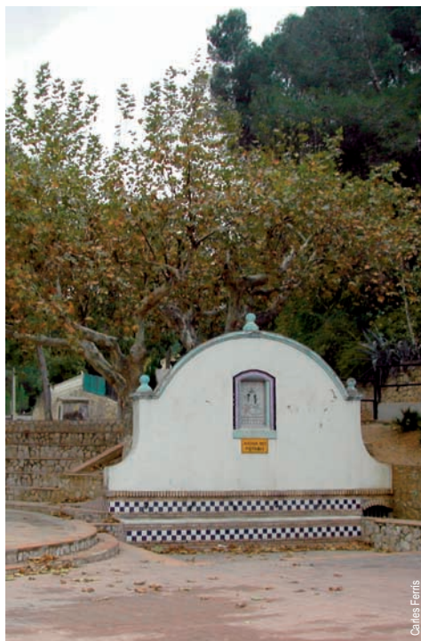
La Font Jordana de Agullent

entidad promotora: Ayuntamiento de Agullent