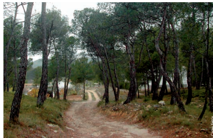
Camino a las Casas de Tabarla, Yátova