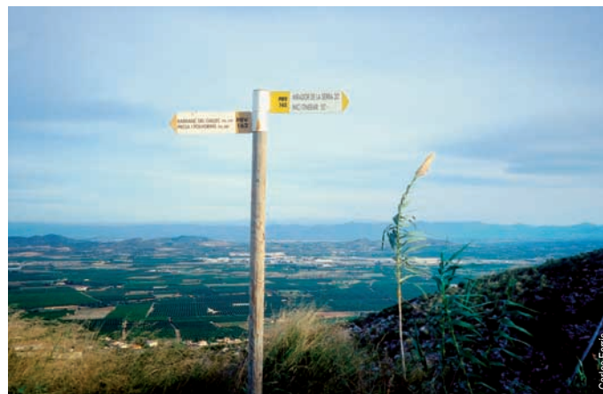
Vista de l'Horta desde la sierra Perenxisa