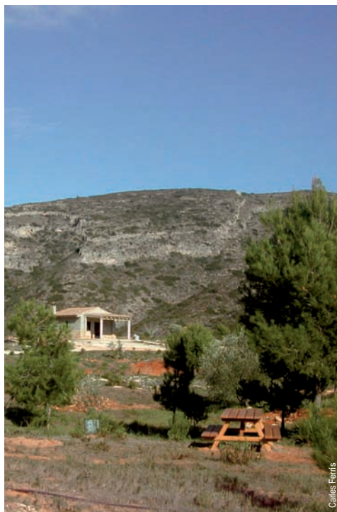
Área recreativa del Pla d'Engullidors, Quatretonda

entidad promotora: Ayuntamiento de Quatretonda