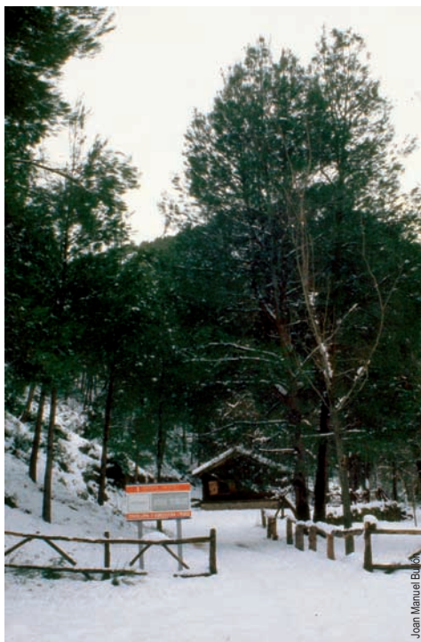
Refugio Agua Tomás, Aras de los Olmos

entidad promotora: Ayto.de Aras de los Olmos