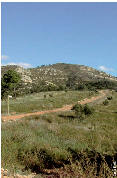
Senda al Pico Nevera

comarca: La Hoya de Buñol recorrido: 29,6 km tiempo: 7 h 45' dificultad: alta cartografía: 1:50.000 Cheste 721 (28-28) entidad promotora: Ayuntamiento de Buñol