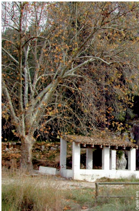
Paraje de Alboi, Genovés

entidad promotora: Ayuntamiento de Genovés