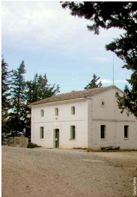
Casa forestal de les Planisses

Ayuntamientos de Ràfol de Salem y Beniatjar