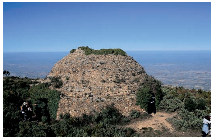
Nevera del Benicadell