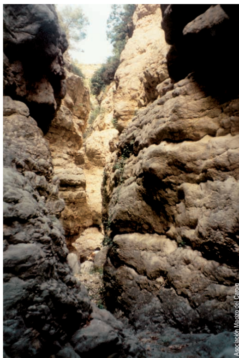
La Gola de Lucino

entidad promotora: Asociación Macizo del Caroig