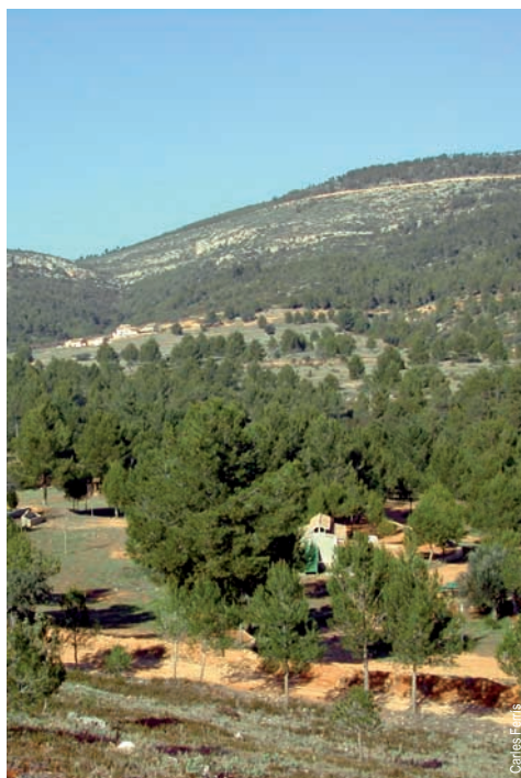
Casas del Benefetal y zona de acampada, Bicorp

entidad promotora: Asociación Macizo del Caroig