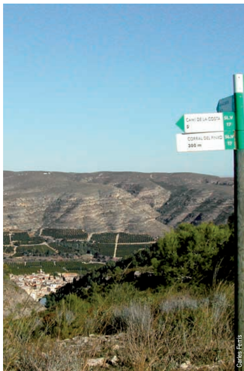
Sumacàrcer desde el Alto de la Ceja

comarca: La Ribera Alta recorrido: 4,5 km tiempo: 2 h 30' dificultad: baja cartografía: 1:50.000 Navarrés 769 (28-30) entidad promotora: Ayuntamiento de Sumacàrcer