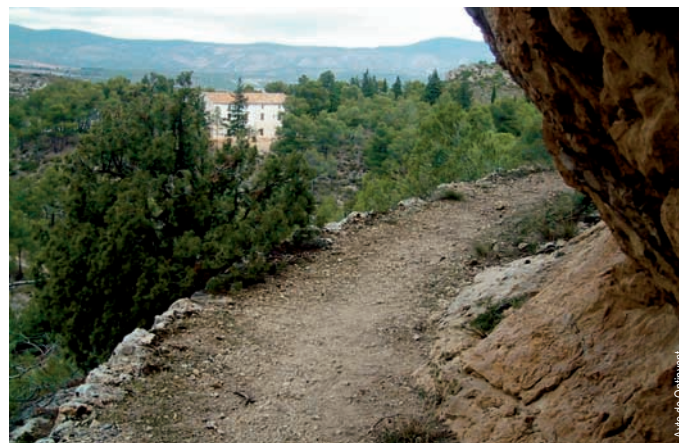
Senda y casa forestal de Gamellons