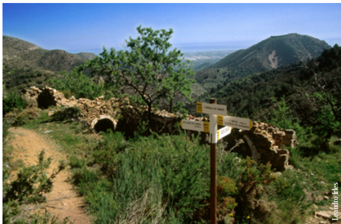
Corrales del Tumo