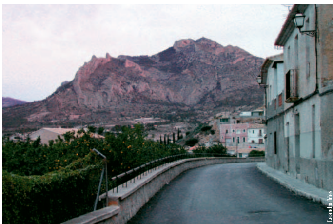
Busot y sierra del Cabeçó d'Or