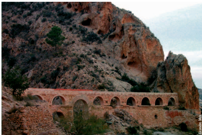
Els Pontets, Crevillente