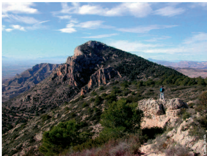
Picacho de San Cayetano