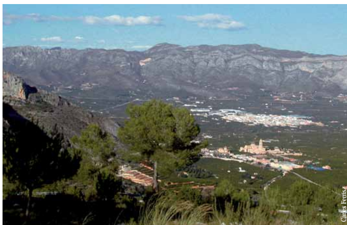
La Valldigna y el Monasterio de Santa María desde Barx