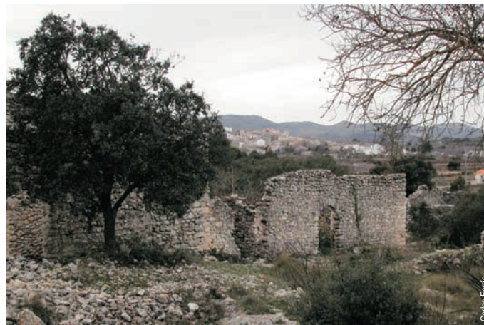
El poblado morisco de Adsubia, Alcalà de la Jovada