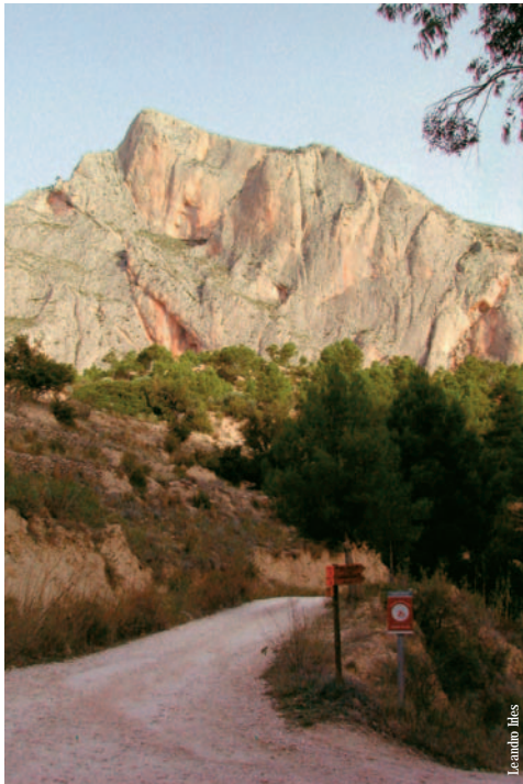
Puig Divino, Benimantell

entidad promotora: Diputación de Alicante