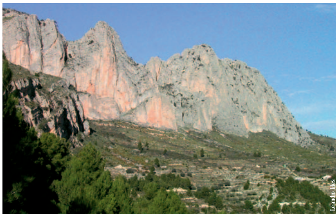
Vista de Penya Roc, Benimantell